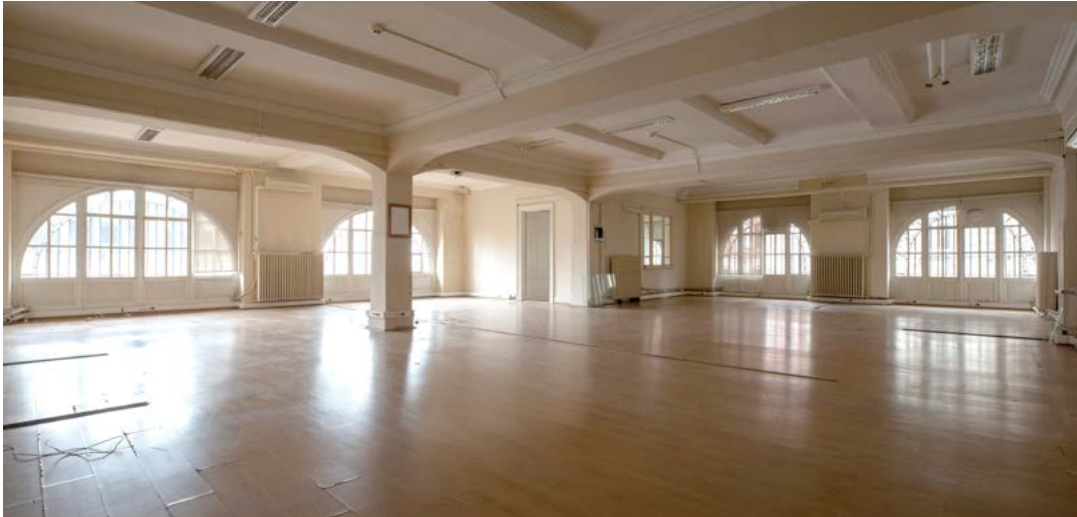
Fotoğraf 13. Metrohan (2020-2023)

İlk üç katında restorasyon çalışmaları tamamlanan tarihi anda sergiler, konserler, söyleşiler ve tiyatro gösterimleri yapılmaktadır. İstanbulluların yaşamında iz bırakan tarihi yapı, geçirdiği işlev değişikliğinin ardından güncel sergilerle sanat dünyasını yansıtan bir mekâna dönüşmüştür.