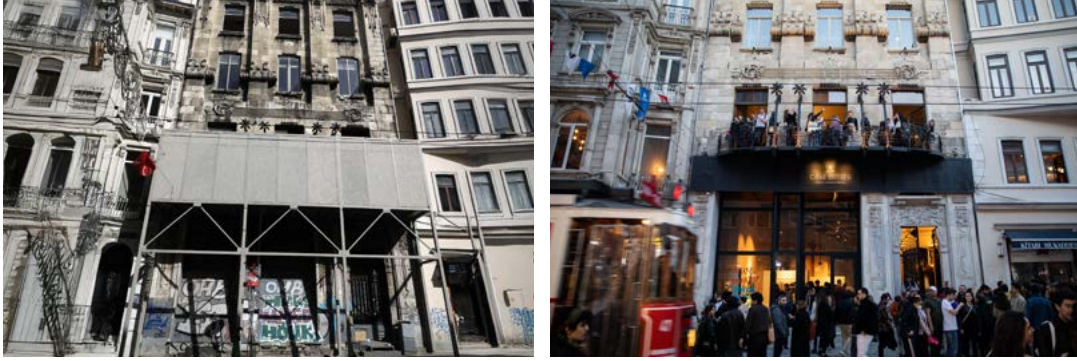
Fotoğraf 8. Botter Apartmanı (Casa Botter) (2021-2023)

Kaynak: İBB Miras arşivinden alınmıştır.