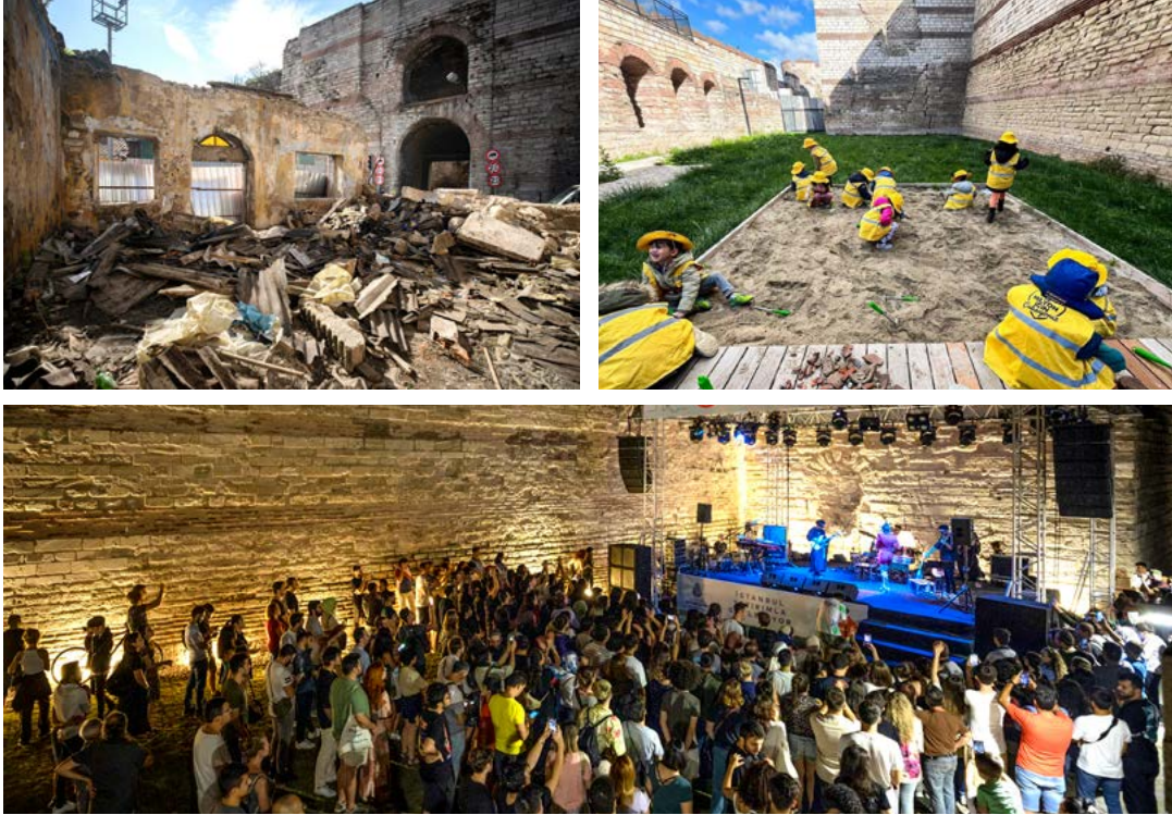
Fotoğraf 12. Kara Surları (2021-2022)