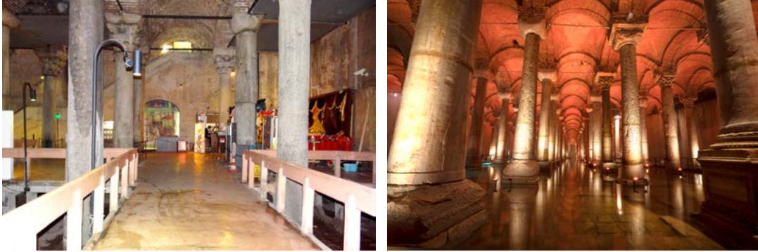
Fotoğraf 14. Yerebatan Sarnıcı (2017-2022)

Kaynak: İBB Miras arşivinden alınmıştır.