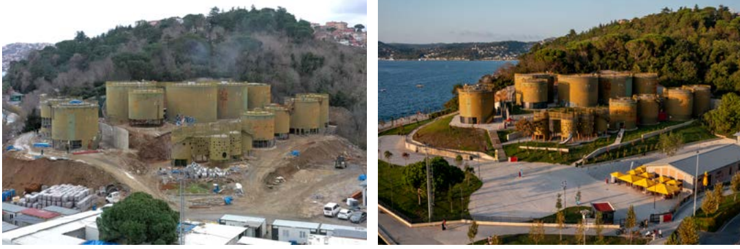
Fotoğraf 3. Beykoz Çubuklu Silolar Eski ve Yeni Hali (2022-2024)

Kaynak: İBB Miras arşivinden alınmıştır.