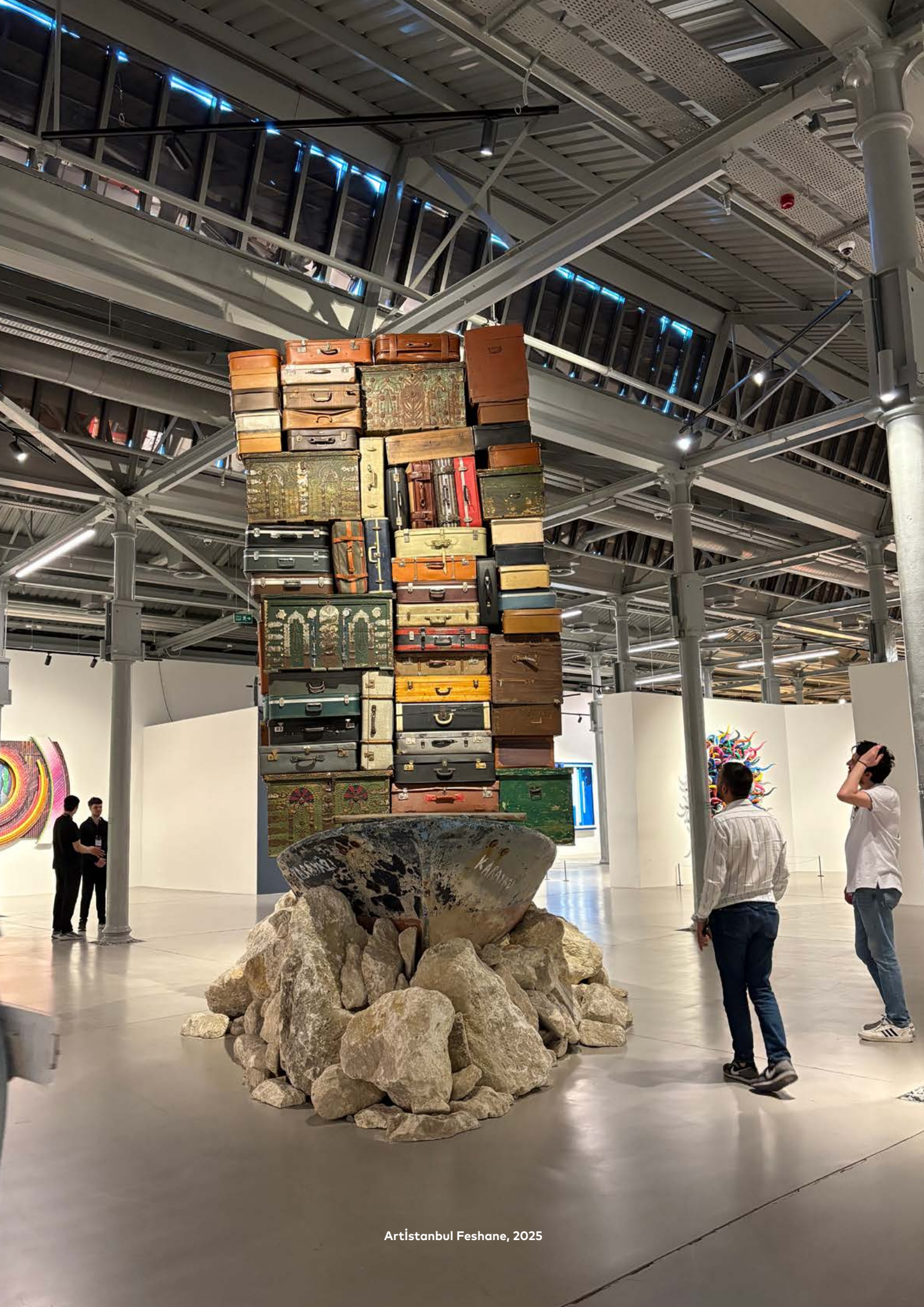
Artİstanbul Feshane, 2025