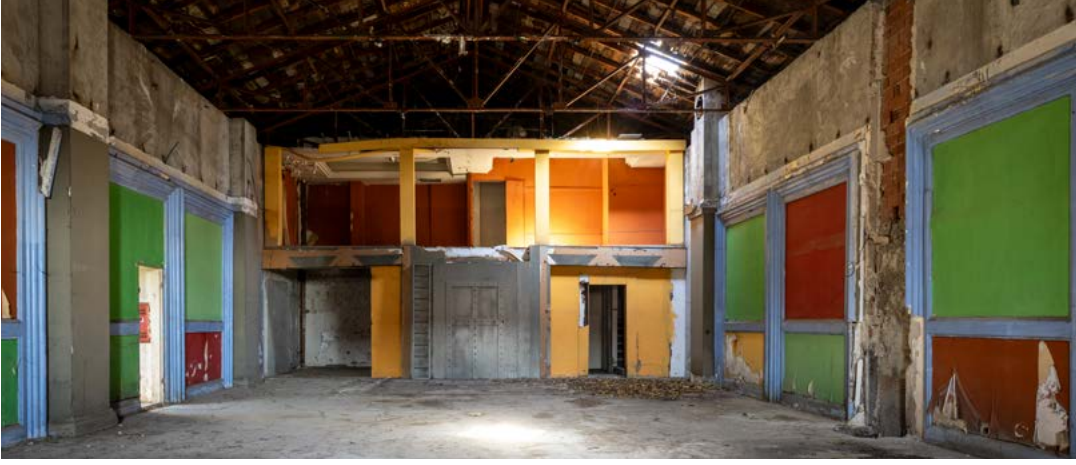
Fotoğraf 5. Ataköy (Bakırköy) Baruthanesi (2022-2024)