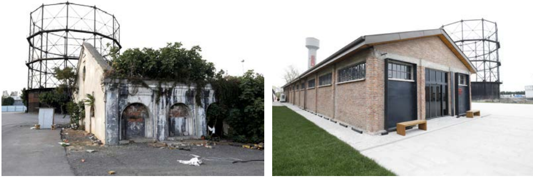
Fotoğraf 7. Yedikule Gazhanesi(2021-2023)