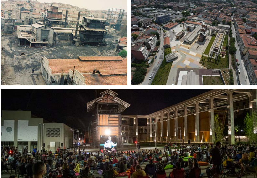
Fotoğraf 1. Müze Gazhane Eski ve Yeni Hali (1994-2021)

Kaynak: İBB Miras arşivinden alınmıştır.