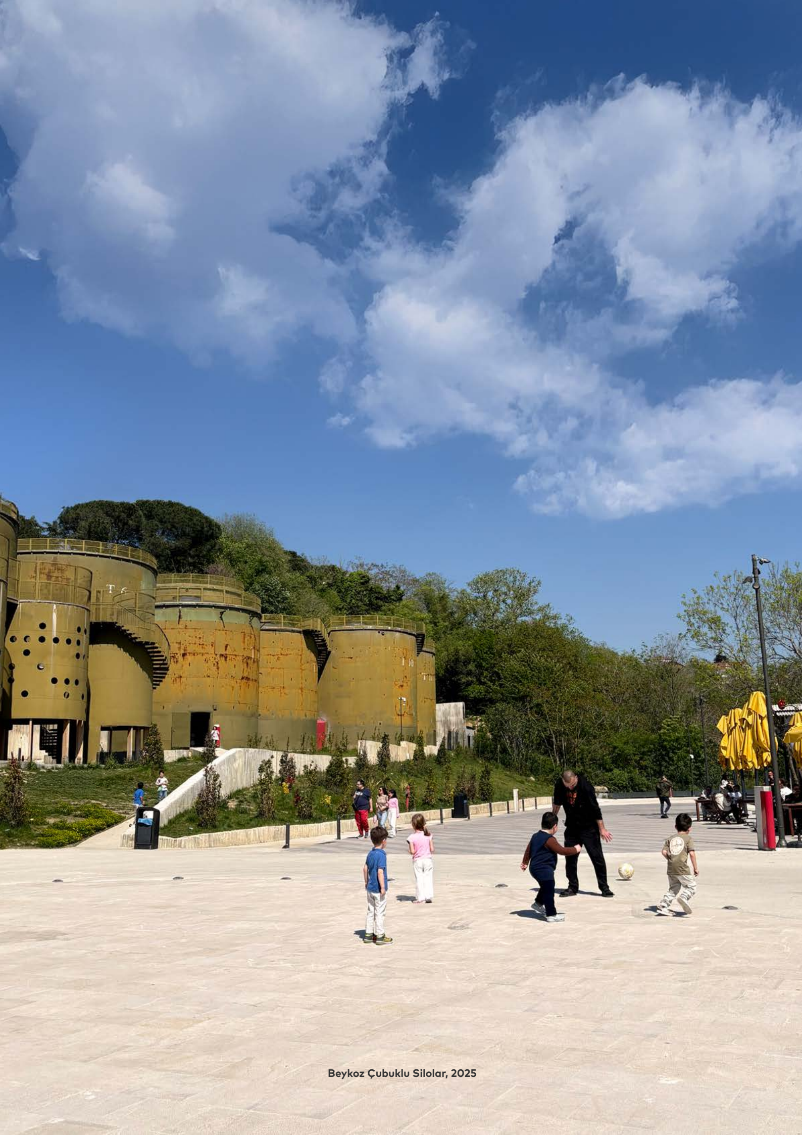
Beykoz Çubuklu Silolar, 2025