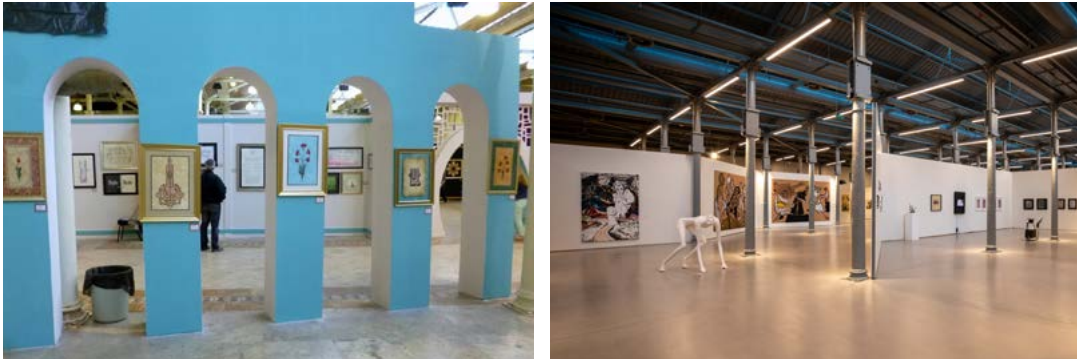
Fotoğraf 4. Artistanbul Feshane Eski ve Yeni Hali (2014-2024)