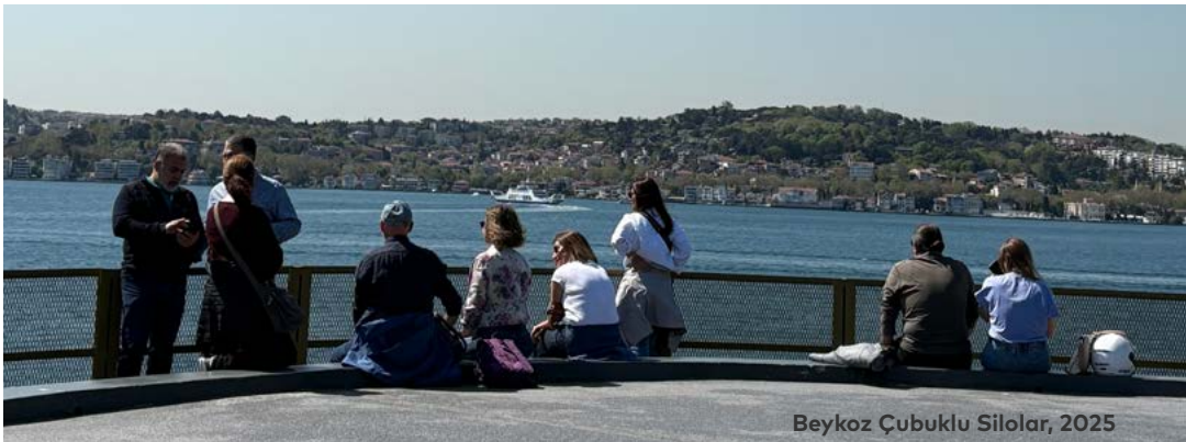
Beykoz Çubuklu Silolar, 2025

Görüşmeciler bu alanların özelleştirme, ticarileştirme ve yüksek gelir grubuna yönelik kullanım biçimlerine karşı; erişilebilir, kapsayıcı ve kamusal nitelikte kalmasının hayati önem taşıdığını vurgulamaktadır. Beykoz Çubuklu Silolar'da yapılan görüşmelerde belirtildiği gibi, İstanbul Boğazı gibi değerli bir bölgede yer alan bu alanın halkın kullanımına açılması, yalnızca mekânsal bir düzenleme değil, aynı zamanda kentteki özelleştirme ve ticarileştirme politikalarına karşı güçlü bir toplumsal duruşun ifadesi olmaktadır. Bu yaklaşım, kentin sadece ayrıcalıklı kesimlere değil, tüm sakinlerine ait olduğu fikrini güçlendirmektedir.