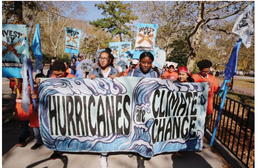
OneNYC 2050 stratejisinin en önemli vurgularından biri iklim krizi ve yeşil yeni düzen tartışmaları üzerinedir. Kaynak http://onenyc.cityofnewyork.us/

Her yıl yayınlanan ilerleme raporları halka açık bir şekilde yayınlanmaktadır. Ayrıca internet sitesinden online olarak izlenebilen bir veri seti de yurttaşların erişimine açıktır.