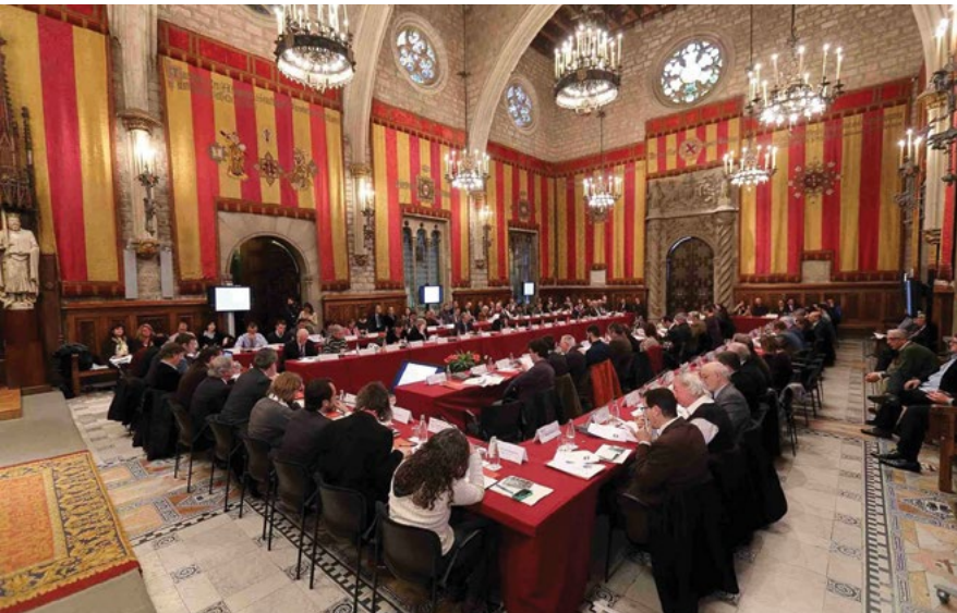
PEMB planlama süreci boyunca her konuya odaklanan etkinlikler gerçekleştiriyor. Kaynak pemb.cat

Plan çerçevesinde öngörülen katılım süreci toplantılar, etkinlikler ve çeşitli yöntemlerle gerçekleştirilen anket çalışmalarından oluşmaktadır. İlk olarak, City Forum 2030 adında bir tartışma forumu oluşturulmuş ve 2500 kadar Berlinli farklı konular hakkında Berlin'in çeşitli toplantı ve konferans mekânlarında yüz yüze tartışmalar yürütmüşlerdir. Ayrıca STK'lar ile ekonomi ve araştırma sektörlerinden katılımcılarla çalıştaylar düzenlenmiştir.