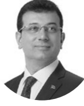
Ekrem İmamoğlu İstanbul Büyükşehir Belediye Başkanı