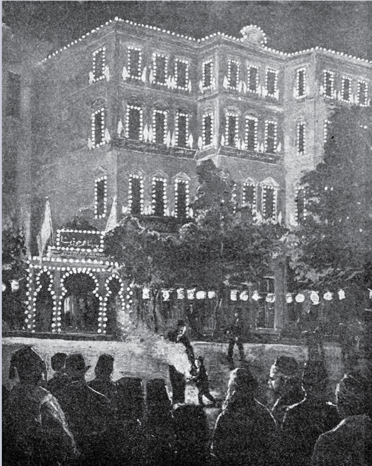
II. Abdülhamid'in Cülus-ı Hümayun töreninde Malumat Matbaası'nın tenviratı. Malumat, 31 Ağustos 1898, sayı 351.