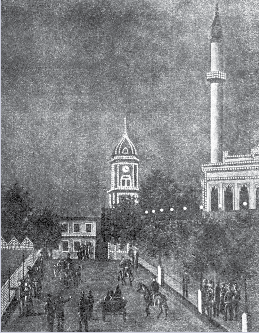
Yıldız Sarayı yakınındaki Hamidiye Camii ve saat kulesinin gece aydınlatması. Malumat mecmuası, 23 Eylül 1897, sayı 1.