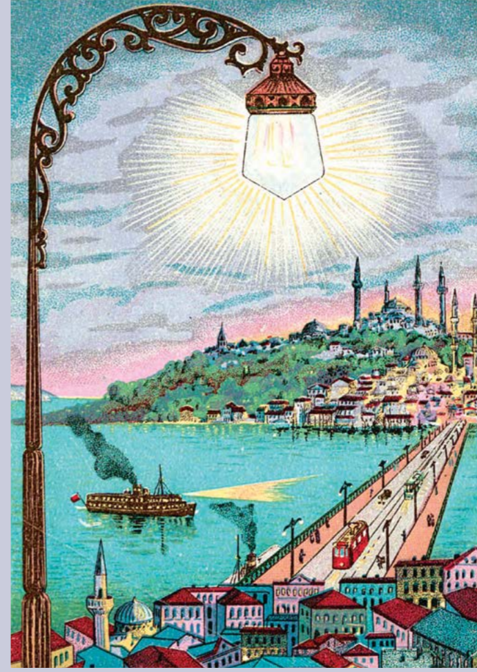
Ameli Elektrik dergisi, Şubat 1926, sayı 3.