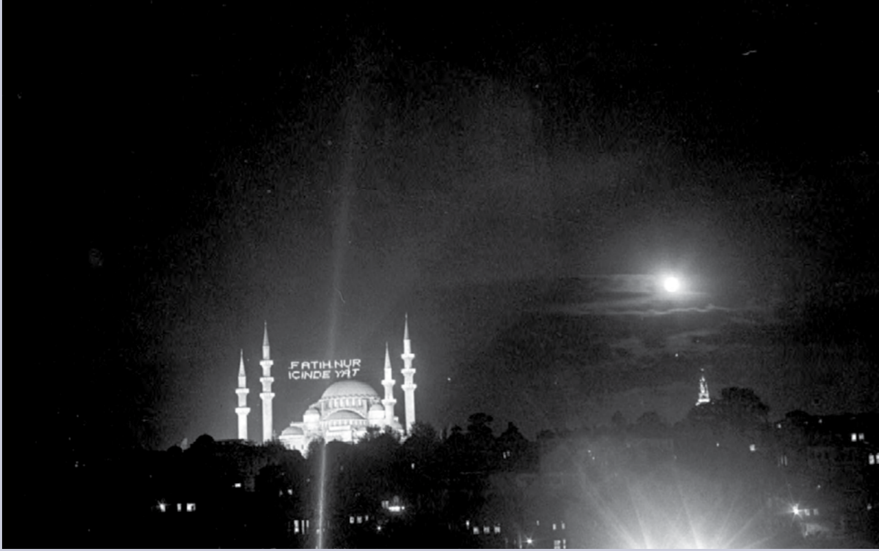
Süleymaniye Camisi her Ramazan'da İstanbul'da en güzel mahyaların kurulduğu selatin camilerden birisi olurdu.