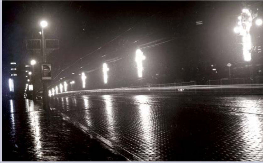
Cumhuriyet'in 10. yılı kutlamalarında Galata Köprüsü de aydınlatılarak süslendi.