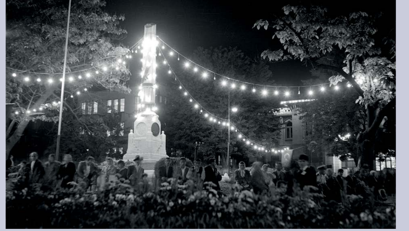
Ampullerle aydınlatılan Fatih Parkı'ndaki Tayyare Şehitleri Anıtı ve çevresi