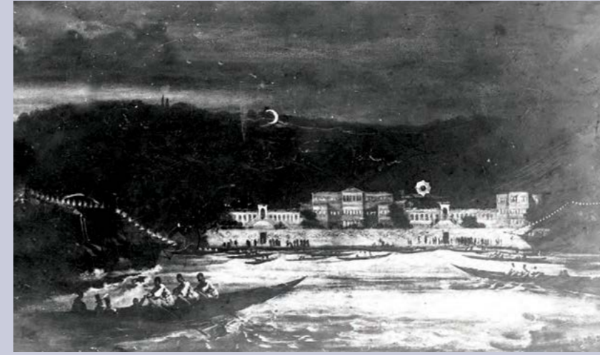
Dolmabahçe Sarayı'na yerleştirilmiş bir elektrik lambası öyle bir ışık saçmıştı ki, toplanma alanında gaz ve kandil kullanılmasına gerek bırakmamış ve geceyi gündüze çevirmişti. Temsili bir resimle Dolmabahçe Sarayı ve çevresi aydınlatılmış şekilde tasvir edilmiş.