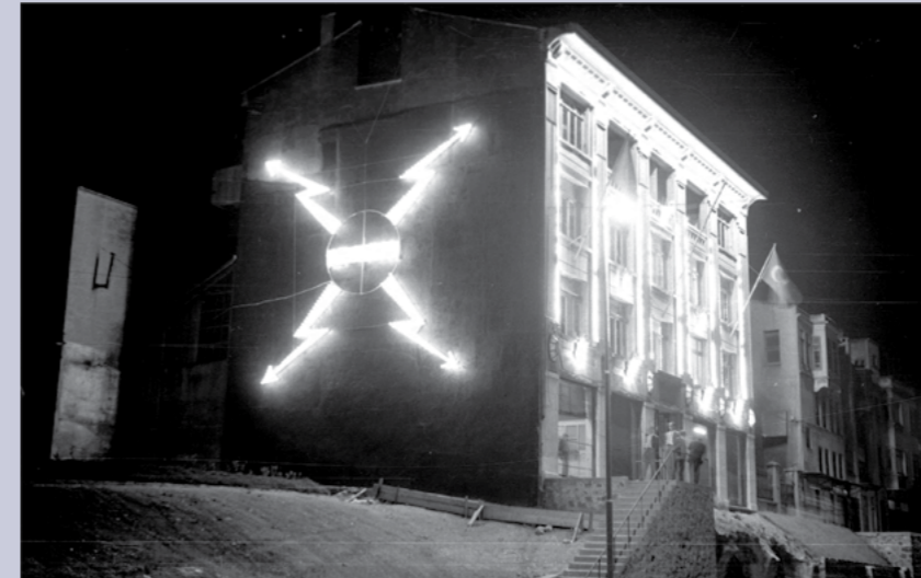
İstanbul'daki Cumhuriyet Bayramı kutlamalarında ilginç bir düzenlemeyle aydınlatılmış apartman.