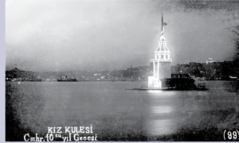
İstanbul'un her tarafı "nurdan bir ziya" şeklindeydi. Şehrin simgelerinden Kız Kulesi de ampullerle aydınlatılmıştı.