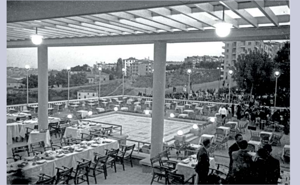
İstanbul Belediyesi'nin Lütfi Kırdar dönemindeki başlıca prestij yapılarından biri olarak tasarlanan Taksim Belediye Gazinosu'nun bahçesi.