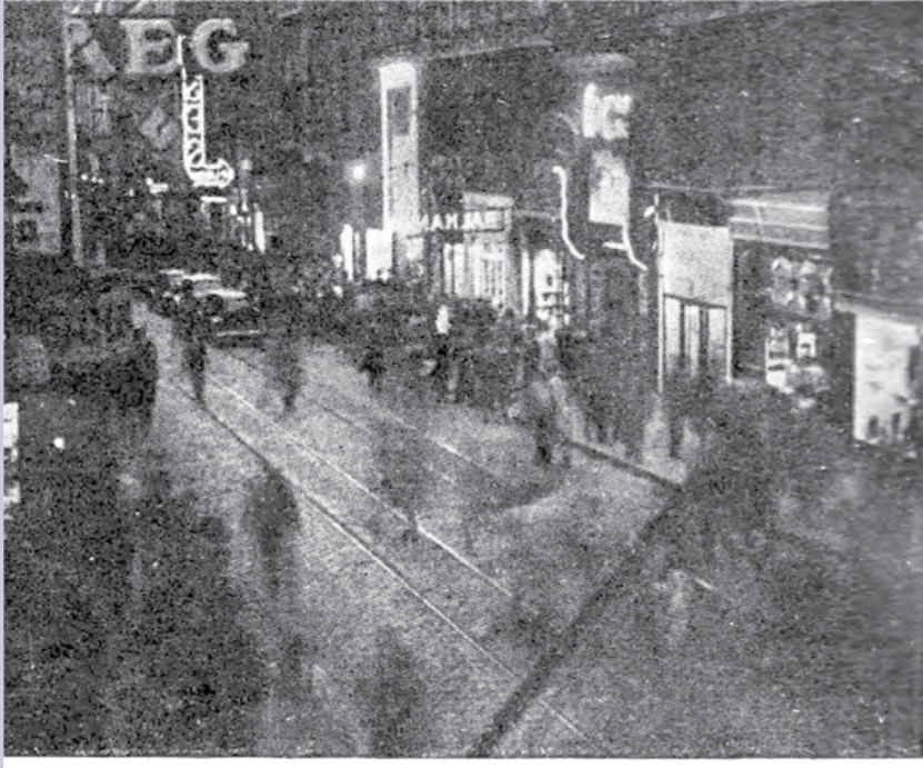
Istanbulun ışıklara kavuşması şehir halkını çok sevindirdi. Tarihe karışan karartma ile beraber Beyoğlu caddesi eski neşesini buldu.

Yedi Gün dergisi 10 Kasım 1944 tarihli sayısında İkinci Dünya Savaşı için alınan önlemlerin ve tatbikatların sona erdiğini duyurdu.