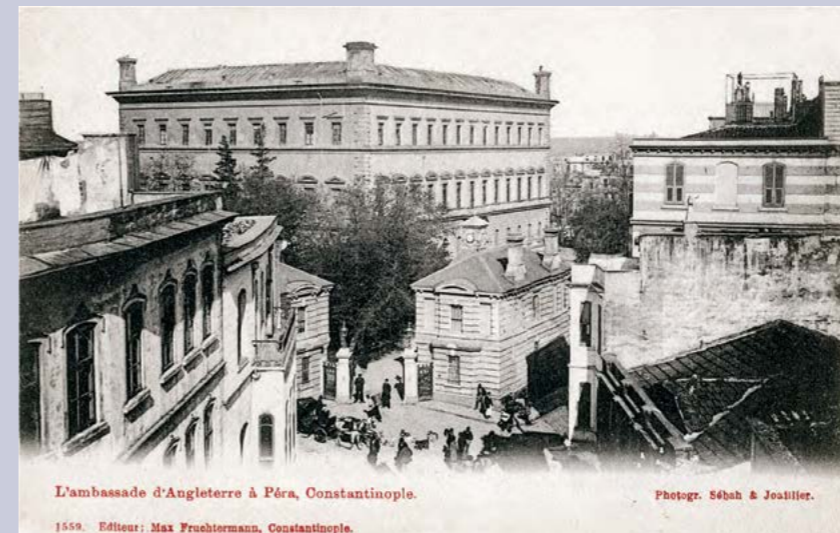
Beyoğlu'ndaki İngiltere elçilik binası İstanbul'da elektrik ışığıyla aydınlatılan ilk binalardandı.