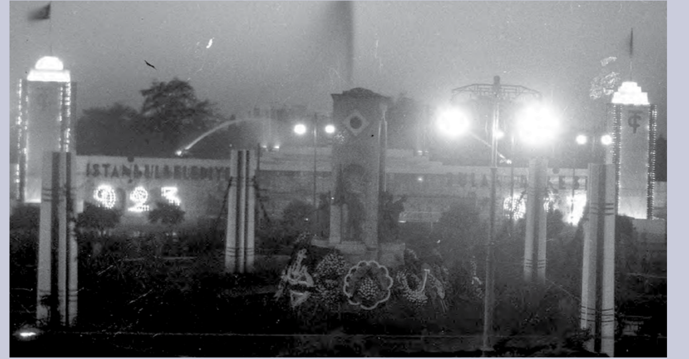
Süleymaniye Camisi her Ramazan'da İstanbul'da en güzel mahyaların kurulduğu selatin camilerden birisi olurdu.