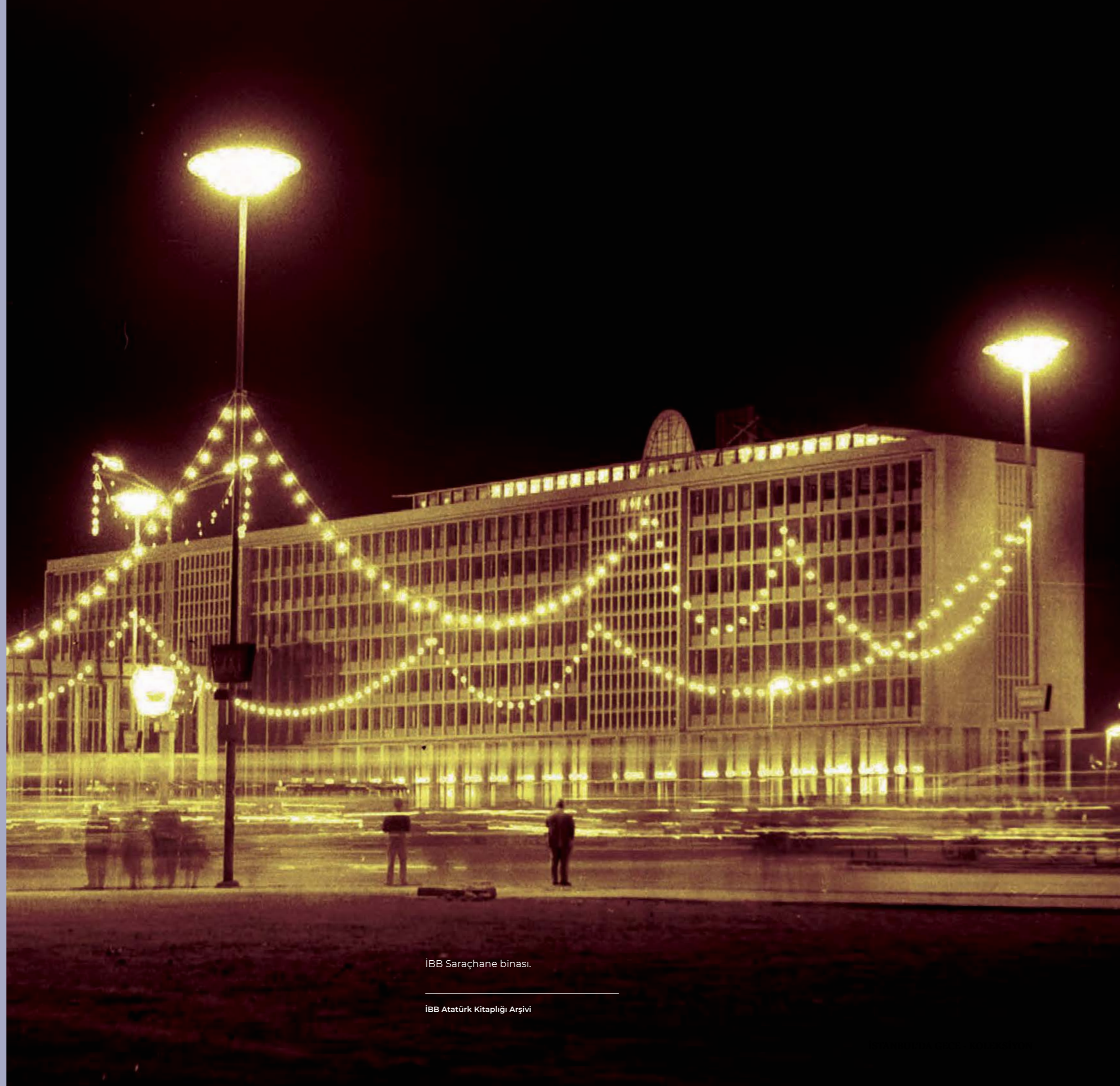
İBB Saraçhane binası.