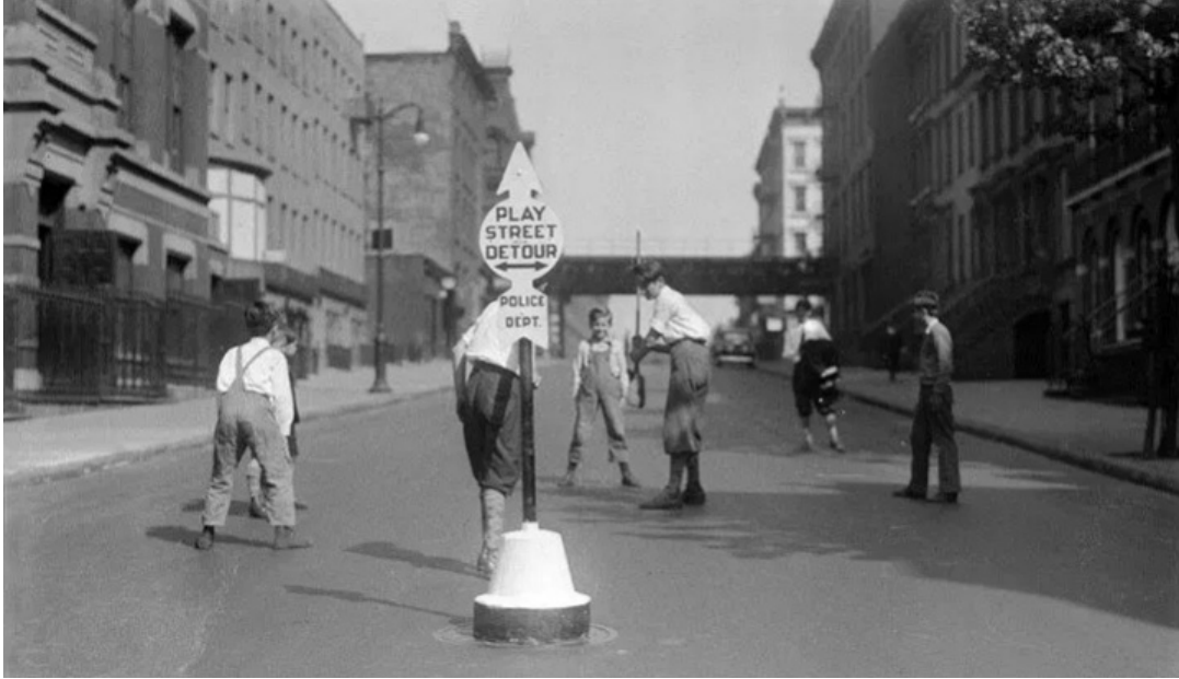
Resim 1. New York'tak ilk oyun sokaklarından bir görsel

Oyun sokakları fikri, 20. yüzyılın başlarında New York'ta doğmuştur. Motorlu taşıtların yollara hakim olmaya başlamasıyla sokakları oyun alanı olarak kullanan çocukların trajik ölümleri sonucunda toplum liderleri, çocuklarının risk almadan dışarıda oynayabilmesi için sokakların bazı bölümlerinin trafiğe kapatılması yönünde dilekçe vermişlerdir. 20 1938 yılında Birleşik Krallık tarafından yasalaştırılan oyun sokakları, daha sonra Avustralya tarafından da benimsenmiş; birçok ABD şehrinde bugün halen daha uygulanmakta olan bir yaklaşımdır. Örneğin Chicago 2012 yılından bu yana oyun sokaklarına izin vermekte ve her yaz 150 veya daha fazla oyun sokağına sponsor olmayı hedeflemektedir. Los Angeles'ta yaşayanlar, haftalık veya aylık olarak tekrarlanan dört ila altı saatlik sokak kapatma başvurusunda bulunabilmektedir. 21