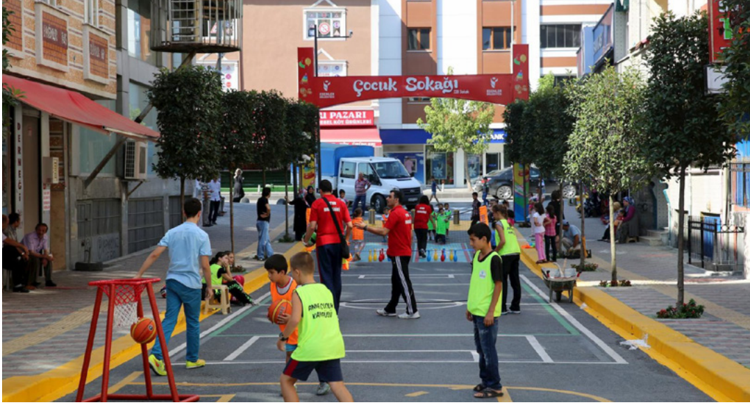
Resim 3. Esenler Menderes Mahallesi Çocuk Sokağı