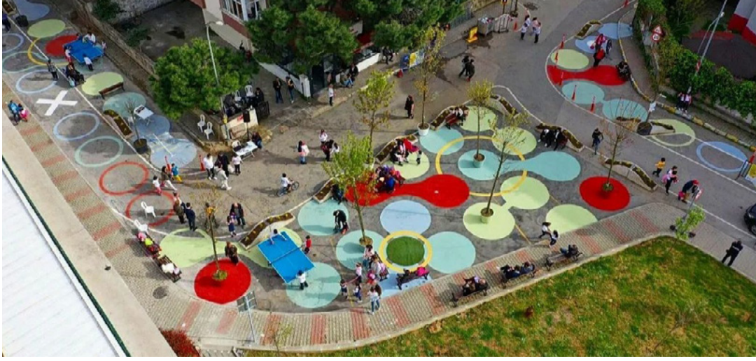
Resim 2. Maltepe Yalı Mahallesi Yaya Öncelikli Sokak